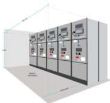
Figura 3.4. a. Espacios para montaje de equipos.

“Cuando se tengan partes energizadas expuestas con tensión fase tierra menor o igual a 150 V, el espacio de trabajo mínimo no debe ser inferior a 2 m de altura (medidos verticalmente desde el piso o plataforma) o la altura del equipo cuando este sea más alto, 0,76 m de ancho o el ancho del equipo si este es mayor; y 0,9 m de profundidad del espacio de trabajo frente al equipo. En todos los casos, el espacio de trabajo debe permitir la apertura a 90° de puertas de los equipos. Para tensiones mayores a 150 V y menores o iguales a 1.000 V fase-tierra, se debe aplicar lo señalado en el numeral 110.26 de la NTC 2050 segunda actualización. Para instalaciones de más de 1.000 V fase-tierra, la altura del espacio de trabajo debe ser como mínimo de 2 metros, con un ancho no inferior a 0,92 m y con una profundidad definida por las condiciones de la tabla 110.34 (A) de la norma NTC 2050 segunda actualización, teniendo en cuenta las excepciones del artículo 110.34 de la mencionada norma. Para mayor claridad se debe tener en cuenta la Figura 3.4.a”